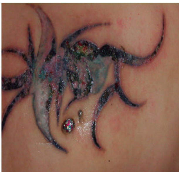
Figura 1. Lesiones aparecidas en una paciente tras dos semanas de una sesión de láser para eliminar tatuajes en un centro no sanitario.

tos cuya composición es muy compleja y tienen una gran resistencia a su eliminación. En estos casos se recomienda realizar "ensayo y error", es decir, se irradia una zona pequeña poco visible y se valora intraoperatoriamente la reacción a dicha irradiación. Si inmediatamente tras la irradiación aparece una ceniza blanca (vapor y burbujas de gas debidos a un rápido calentamiento del tejido) que se resuelve en 20 minutos, el tratamiento es efectivo 25 . También se valorará si hay algunos puntos de sangrado. Si no se observan estas reacciones o bien la dosis es insuficiente o la longitud de onda no es la adecuada.